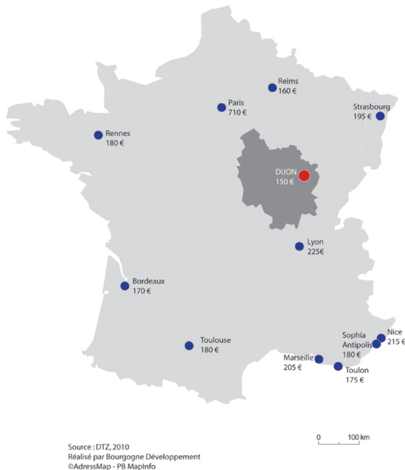
Les loyers prime en France (€/m 2 /an HT-HC) au premier semestre 2010

En lien avec nos partenaires locaux, nous en mesure de vous présenter des offres de bâtiments ou de terrain, à la vente ou à la location. Des solutions sur mesures en fonction de votre cahier des charges peuvent être mises en place.